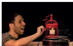
חוזר לישון בתוך התיבה/בית