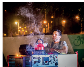
מרתיח קומקום כדי להכין תה