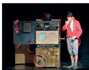
מתעטש ויש לו נזלת