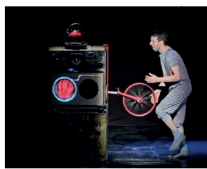
מכבס את הזיקט האדום שלו