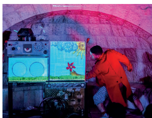
על התיבה מוקרן סרטון