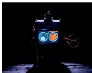
נכנס לתוך מכונת הכביסה